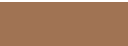
Nussbaum ■ 50976 ■ 95837