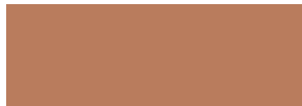
Erle ■ 50977 ■ 95843