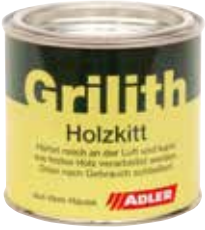
Grilith-Holz kitt kit per legno